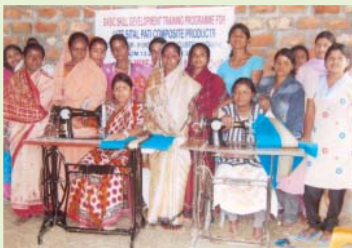
A section of participants at Basic skill Development Training Programme for jute-sital Pati composite production at Sital Pati Cluster Katakhal under MSE-CDP.

Meanwhile Katakhal Patikar Co-op. Ltd. has been proposed and accepted as the SPV for the Cluster. A proposal for a CFC in the Cluster is also under consideration and a report is being prepared. The Co-op. proposed to offer its land for the CFC at Katakhal as its contribution and seek generous central support considering the backwardness of the area. This year remuneration for weaving mats increased to Rs. 35-40 from Rs. 20 earlier and impact and share of MSE-CDP is being searched over this positive change.