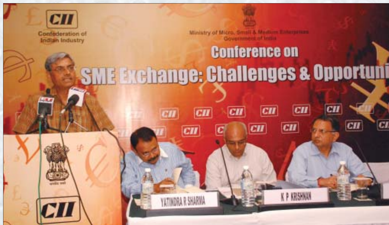
Shri Dinesh Rai, Secretary, Ministry of Micro, Small & Medium Enterprises, Government of India addressing the Conference of SME Exchange: Challenges & Opportunities organised by CII in New Delhi on July 16, 2009. Shri Madhav Lal, Additional Secretary and Development Commissioner, Government of India (extreme right) was also present in the conference.