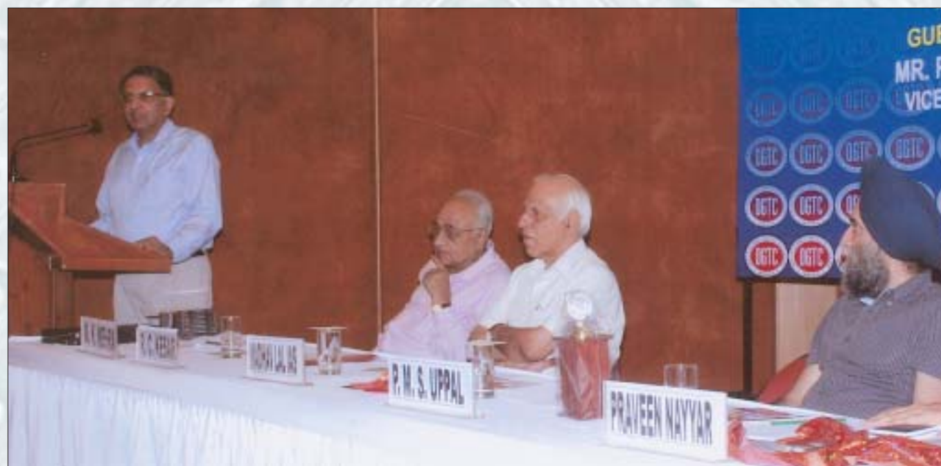
Chief Guest Shri Madhav Lal, Additional Secretary & Development Commissioner, Government of India addressing the 5th annual function of Okhla Garment and Textile Cluster in New Delhi on July 3, 2009.