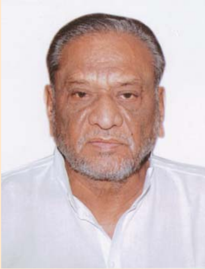
श्री दिनशा जे. पटेल, राज्य मंत्री (स्वतंत्र प्रभार), सूक्ष्म, लघु एवं मध्यम उद्यम मंत्रालय, भारत सरकार।

सूक्ष्म, लघु और मध्यम उद्यम राज्य मंत्री (स्वतंत्र प्रभार) श्री दिनशा पटेल ने दिनांक 21 जुलाई, 2009 को लोक सभा में एक प्रश्न के लिखित उत्तर में बताया कि सरकार ने सूक्ष्म, लघु एवं मध्यम उद्यम मंत्रालय में ग्रामीण रोजगार सृजन कार्यक्रम