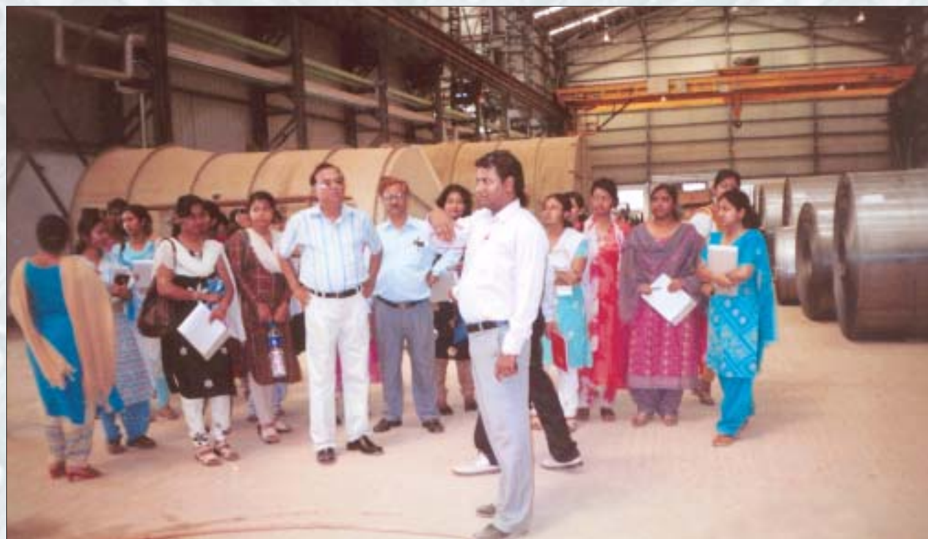
Participants of BSDP are being explained about the tin sheet manufacturing in their industrial exposure. The programme was organised by MSME-DI, Agartala.