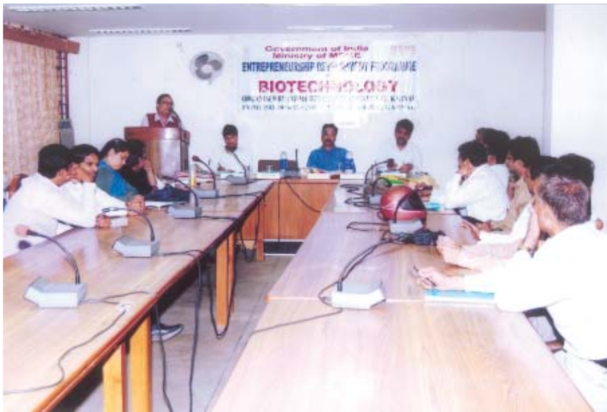
बायोटेक्नोलॉजी पर आयोजित उद्यमिता कौशल विकास प्रशिक्षण कार्यक्रम का एक दृश्य।