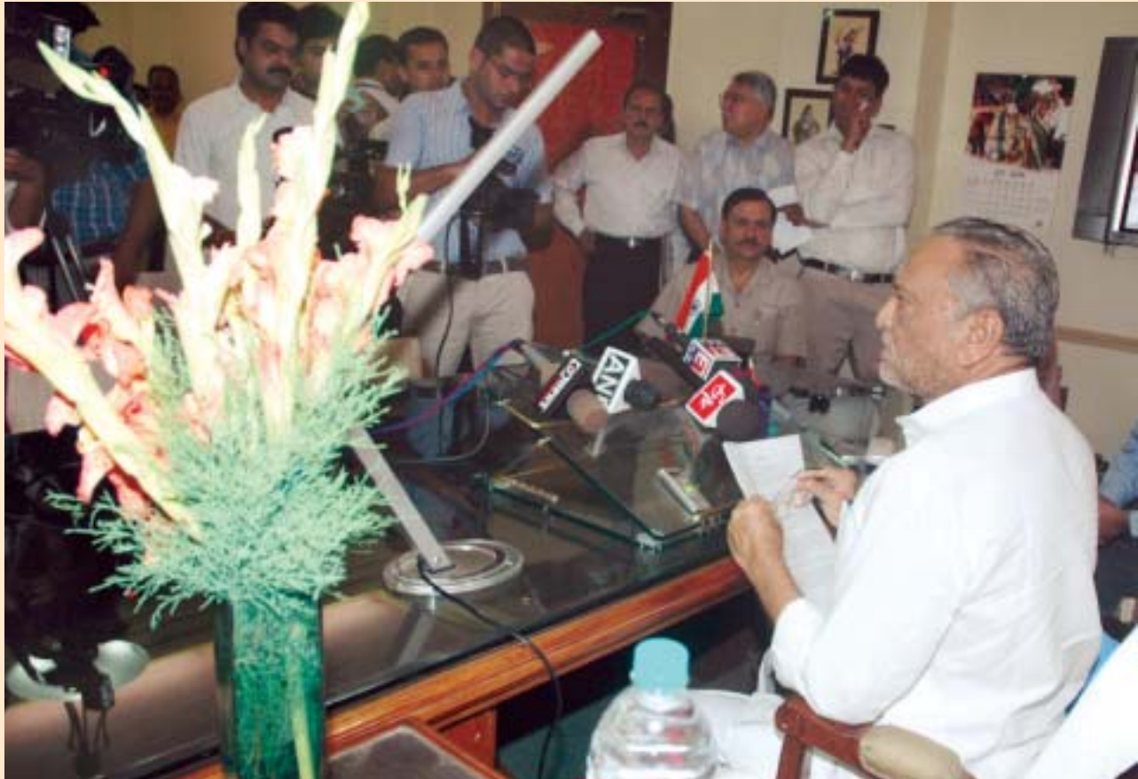
नई दिल्ली स्थित उद्योग भवन में दिनांक 2 जून, 2009 को श्री दिनशा जे. पटेल केन्द्र सरकार में सूक्ष्म, लघु एवं मध्यम उद्यम मंत्री का पदभार संभालने के दौरान पत्रकारों और वरिष्ठ अधिकारियों को सम्बोधित करते हुए।

25 फरवरी 1937 को जन्मे श्री दिनशा झावरभाई पटेल केन्द्र में पेट्रोलियम और प्राकृतिक गैस राज्य मंत्री रह चुके हैं। बाद में वे गुजरात सरकार में लोक निर्माण विभाग और संसदीय कार्यों के कैबिनेट मंत्री रहे।