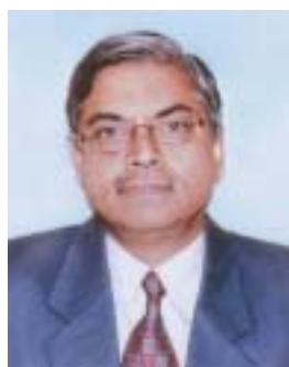
Dinesh Rai Secretary Ministry of Micro, Small and Medium Enterprises Government of India Udyog Bhavan, New Delhi

However, in today's liberalized and globalised environment, there are several preconditions to enhancing the global competitiveness of the MSMEs. These relate mainly to simplified systems and