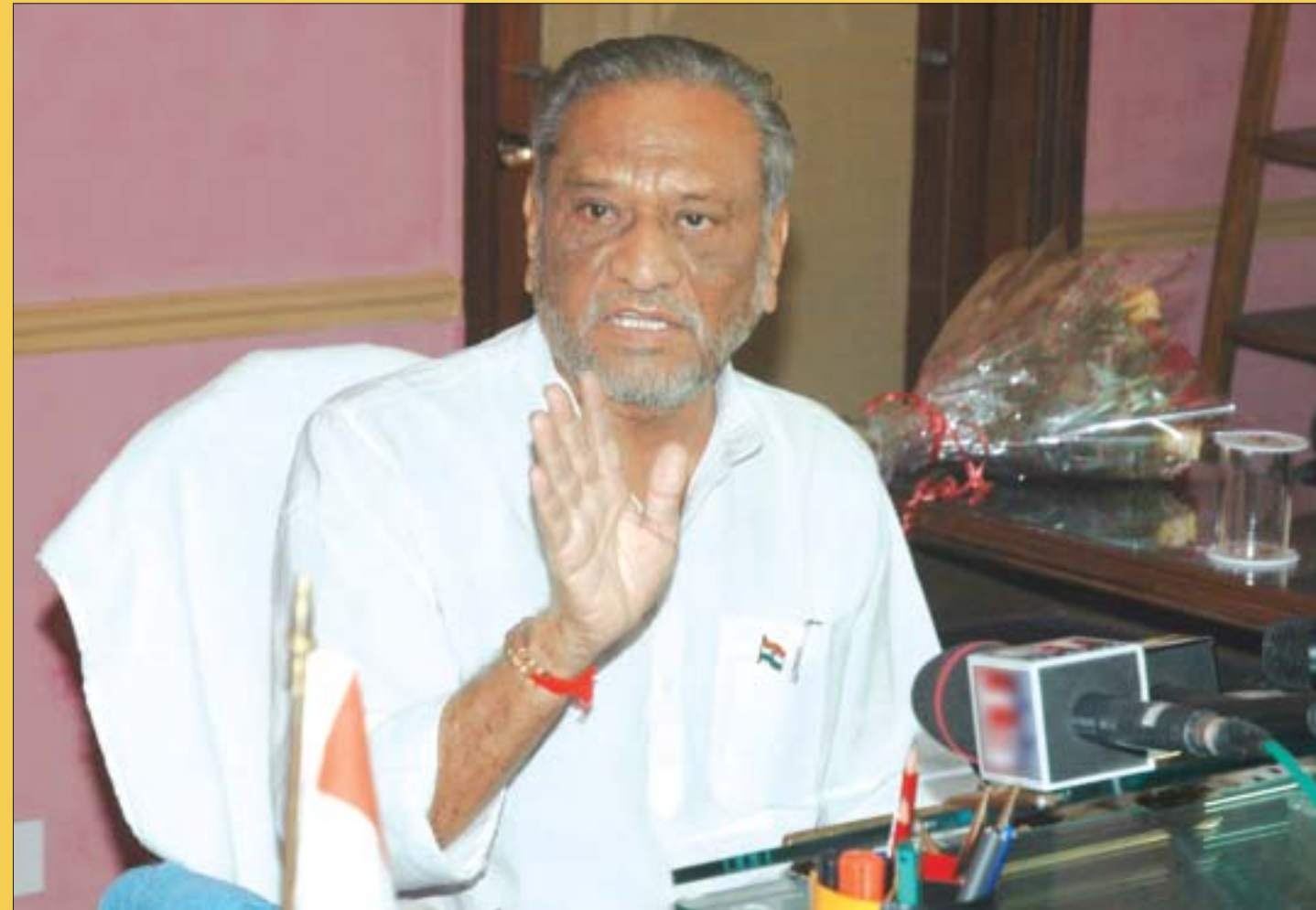
Shri Dinsha J. Patel taking charge as the Minister of State (Independent Charge) for Ministry of Micro, Small & Medium Enterprises, Government of India in New Delhi on June 2, 2009